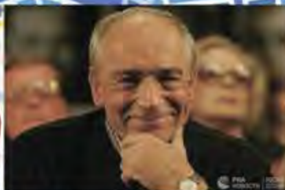
Валентин Иосифович Гафт